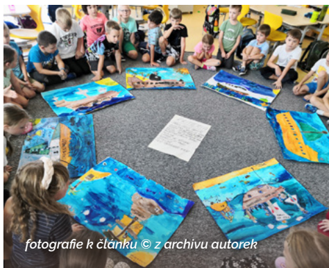
fotografie k článku © z archivu autorek

přechází do role pozorovatele a pomocníka. Sledujeme, jak se dětem daří, poradíme tam, kde děti narazí na problém. Závěr dne patří hodnoticímu kruhu , kde děti prezentují svoji práci, sdílí úspěchy a podporují se navzájem.